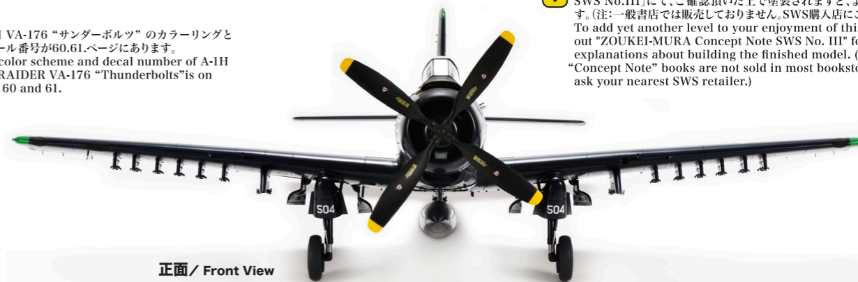
正面 / Front View

! A1-H VA-176 "サンダーボルト"のカラーリングとデカール番号が60.61ページにあります。 The color scheme and decal number of A-1H SKYRAIDER VA-176 "Thunderbolts" is on page 60 and 61.