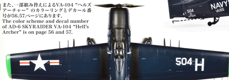
上面 / Top View

! VA-165 "ブーマーズ"のカラーリングとデカール番号が58.59ページにあります。 The color scheme and decal number of AD-6 SKYRAIDER VA-165 "Boomers" is on page 58 and 59.