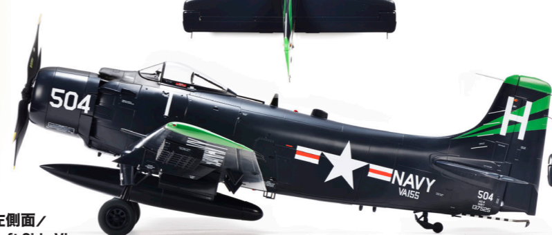
左側面 / Left Side View

! 塗装完成品の組み立て工程を詳しく解説している「造形材コンセプトノート SWS No.III」にて、ご確認頂いた上で塗装されますと、より一層楽しめます。(注:一般書店では販売しておりません。SWS購入店にご注文ください。) To add yet another level to your enjoyment of this kit, check out "ZOUKEI-MURA Concept Note SWS No. III" for detailed explanations about building the finished model. (Note: These "Concept Note" books are not sold in most bookstores. Please ask your nearest SWS retailer.)