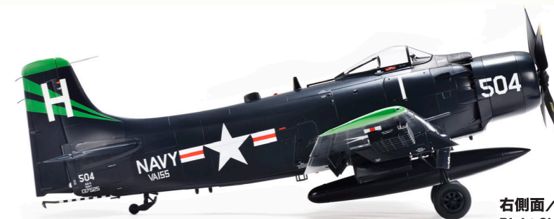
右側面 / Right Side View

! また、一部組み替えによるVA-104 "ヘルズアーチャー"のカラーリングとデカール番号が56.57ページにあります。 The color scheme and decal number of AD-6 SKYRAIDER VA-104 "Hell's Archer" is on page 56 and 57.