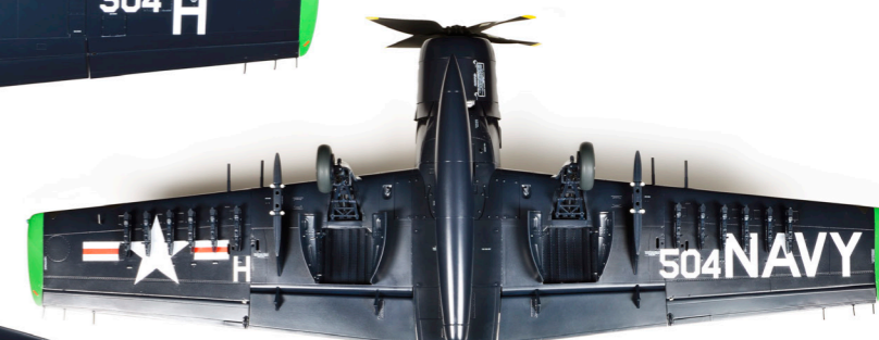
下面 / Bottom View

! VA-165 "ブーマーズ"のカラーリングとデカール番号が58.59ページにあります。 The color scheme and decal number of AD-6 SKYRAIDER VA-165 "Boomers" is on page 58 and 59.